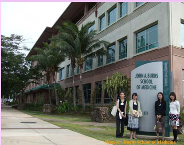
John A. Burns School of Medicine

ハワイメディカルセンター内にある透析センターも見学しました。ハワイ・オアフ島でも透析を必要とされる方は年々増加しているとのことでした。このセンターには20ベッドあり、1日3クルールの透析を行っていました。