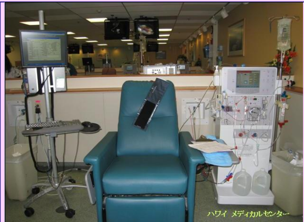
ハワイ メディカルセンター

こちらはクイーンズメディカルセンターという病院を見学した際の1枚です。ハワイ州最大の私立病院で、病床数は急性期病床で505床あります。糖尿病に対しても昏睡、高血糖等の急性期に対応しているとのことでした。実際に患者さんに指導を指導しているCDEの方々からお話を聞くことができました。こちらの病院はAADE/ADA承認の糖尿病教育プログラムを実践しています。