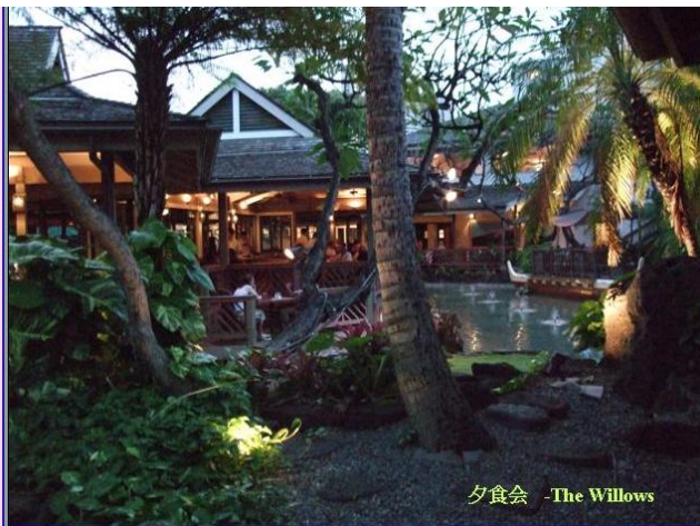
夕食会 -The Willows