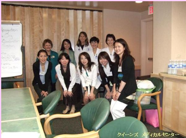
クイーンズ メディカルセンター

こちらはクイーンズメディカルセンターという病院を見学した際の1枚です。ハワイ州最大の私立病院で、病床数は急性期病床で505床あります。糖尿病に対しても昏睡、高血糖等の急性期に対応しているとのことでした。実際に患者さんに指導を指導しているCDEの方々からお話を聞くことができました。こちらの病院はAADE/ADA承認の糖尿病教育プログラムを実践しています。